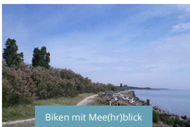
Biken mit Mee(hr)blick

Von Porto Garibaldi immer der Bike-Route (kleine braune Tafeln) in Richtung Lido di Volano, Pomposa, Venezia folgen. Durch die Küsten-Städtchen Lido degli Scacchi, Lido di Pomposa und Lido delle Nazioni, dann geht es mal überraschend links weg in ein kleines Wäldchen. Über den kleinen Pfad erreicht man die erste Aussichtsstelle mit traumhaftem Meerblick und bizarren Schwemmholz-Kreationen.